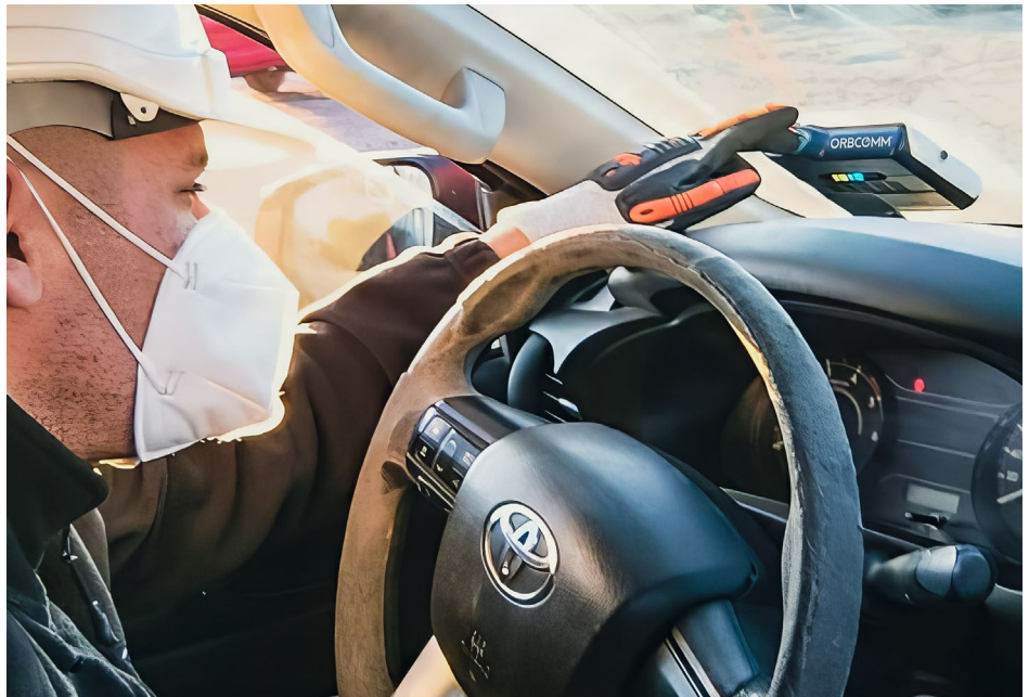
Motorista interagindo com o dispositivo de segurança da frota da ORBCOMM na cabine

Esse conhecimento pode ser passado pela Do Better aos seus clientes, permitindo que eles criem planos de treinamento específicos para a operação, respaldados pelos dados.